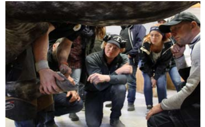
Nya perspektiv. Vinklar och balans i hoven synas nogga.