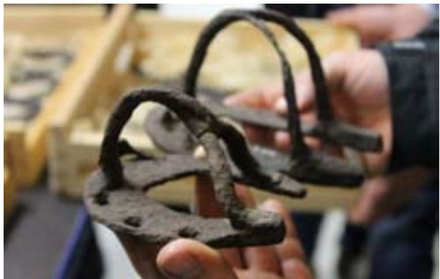
Föregångare. Deltagarna fick också se flera hundra år gamla skor på Gotlands museum.