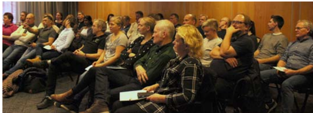
Åhörare. Cirka 25 hovslagare var på plats i Scandic i Mölndal. Mötet i Uppsala hölls på SLU.