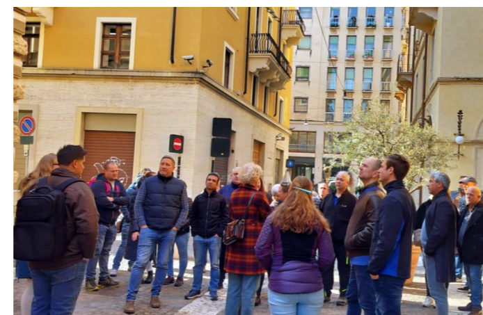
STADSFLANÖRER. EFFA bjöd årsmötesdelegaterna på rundvandring i Verona.

Dag två ägnades åt själva årsmötet. Bland nyheter fanns en ny hemsida och ett framtaget formulär för länder som vill ansöka om medlemskap. En fråga som leddes diskussion var om icke