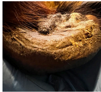
GICK PÅ SULAN.

Den 25 november verkade barfotaverkaren ponnyn igen. Efter den verkningen var ponnyn hårt verkad vittnade både ponnyns