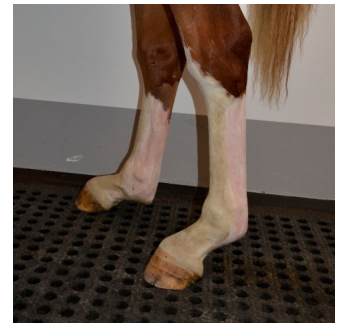
VEKA KOTOR. Åring med DSLD Degenerativ Suspensory Ligament Desmitis.

Ser hoven ändå hel ut men kotan är vek eller hästen eventuellt till och med står lite under sig, då tycker jag att skor med utlägg bakåt är av fördel som till exempel äggsko. Ibland kan även den typen av häst dra tån