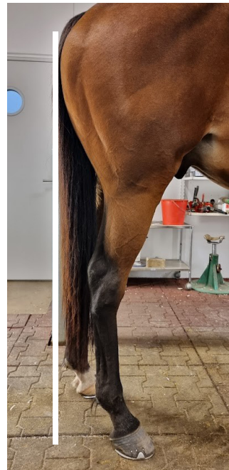
GAMMAL OCH SLITEN. Äldre häst som gärna vill stå under sig.

Hästen, som räknas som ung-häst omkring sex månader till två år, skall normalt inte vara vek i sin stödjeapparat. De man ser som är veka i stödjeapparaten är ofta det i kombination med rakhassighet, där det kan finnas en sjukdom som heter DSLD Degenerative Suspensory Ligament Desmitis. Det är ett sys-