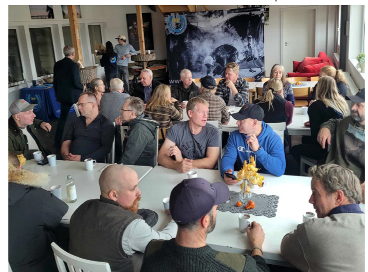
FIKAPÅUS. Smedby Gård kunde erbjuda både föreläsningssal och lunchmatsal. Dessutom fin utsikt över den stora hästanläggningen.