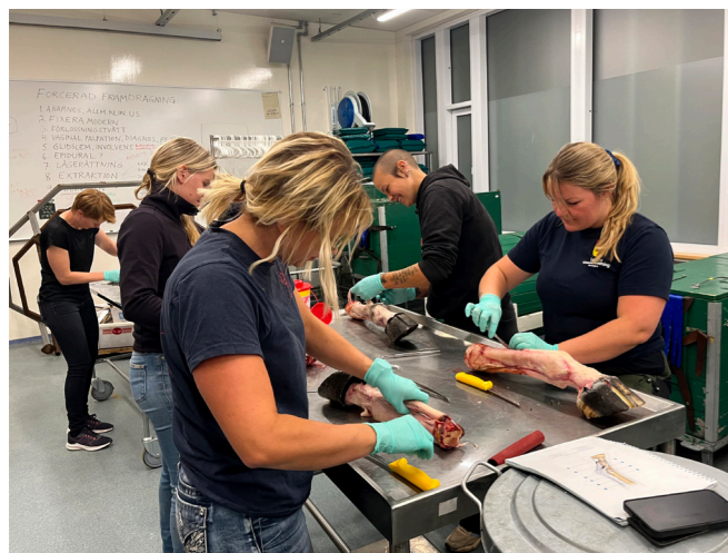
ANATOMI. Bilden är från Block 1.

ditt hotellrum är det alltså viktigt att boka så snart som möjligt. För den som vill avvakta med att boka finns det, om rummen skulle ta slut, andra hotell i närheten. Allt om hur du anmäler dig, bokar hotell och mat och övrig information läggs löpande ut på hemsidan, efterhand som det blir klart. Men ha som sagt extra koll på hotellbokningslänken som kommer ut inom kort.