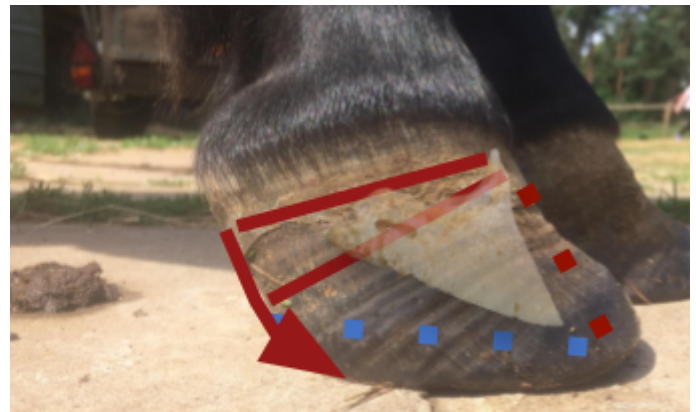
DET YTTRE SPEGLAR DET INRE. Bild som illustrerar hovbenets läge och dom ränder som bildats vid rotation.