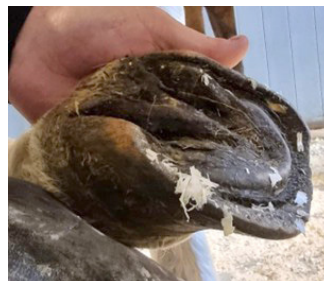
Bild som visar sulans konkavitet vid rotation.

av hovbenets läge i sulan; får vi en rotation så kommer vi att få en mindre konkavitet i sulans tådel. Har man en sänkning så blir sulan mer platt.