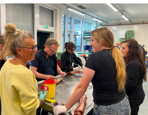
Bilden är från Block 1.

För dem som saknar behörighet att ansöka om godkännande hos Jordbruksverket är fortbildningen en väg att gå. Men, antalet platser är starkt begränsat,